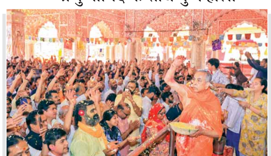
जयपुर। होली के पावन पर्व पर जयपुर के प्रसिद्ध गोविंद देव जी मंदिर में श्रद्धालुगणों ने प्रभु के दर्शन किए। इस अवसर पर मुख्य पुजारी ने पुष्पों की बरसात कर होली खेली।